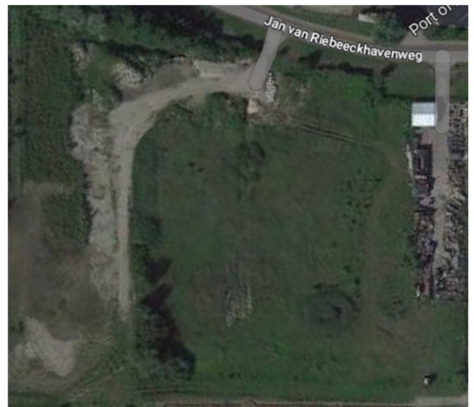
Afbeelding 2: Locatie voor potentiële nieuwe parkeerplaats

De locatie van het erotische cruiseschip bevindt zich naast de ring en is in die zin perfect te bereiken met de auto. Vanaf zowel Amsterdam Centraal Station als station Amsterdam Sloterdijk is de locatie ook goed bereikbaar per fiets. Vanaf Station Sloterdijk is het ongeveer 15 minuten fietsen.